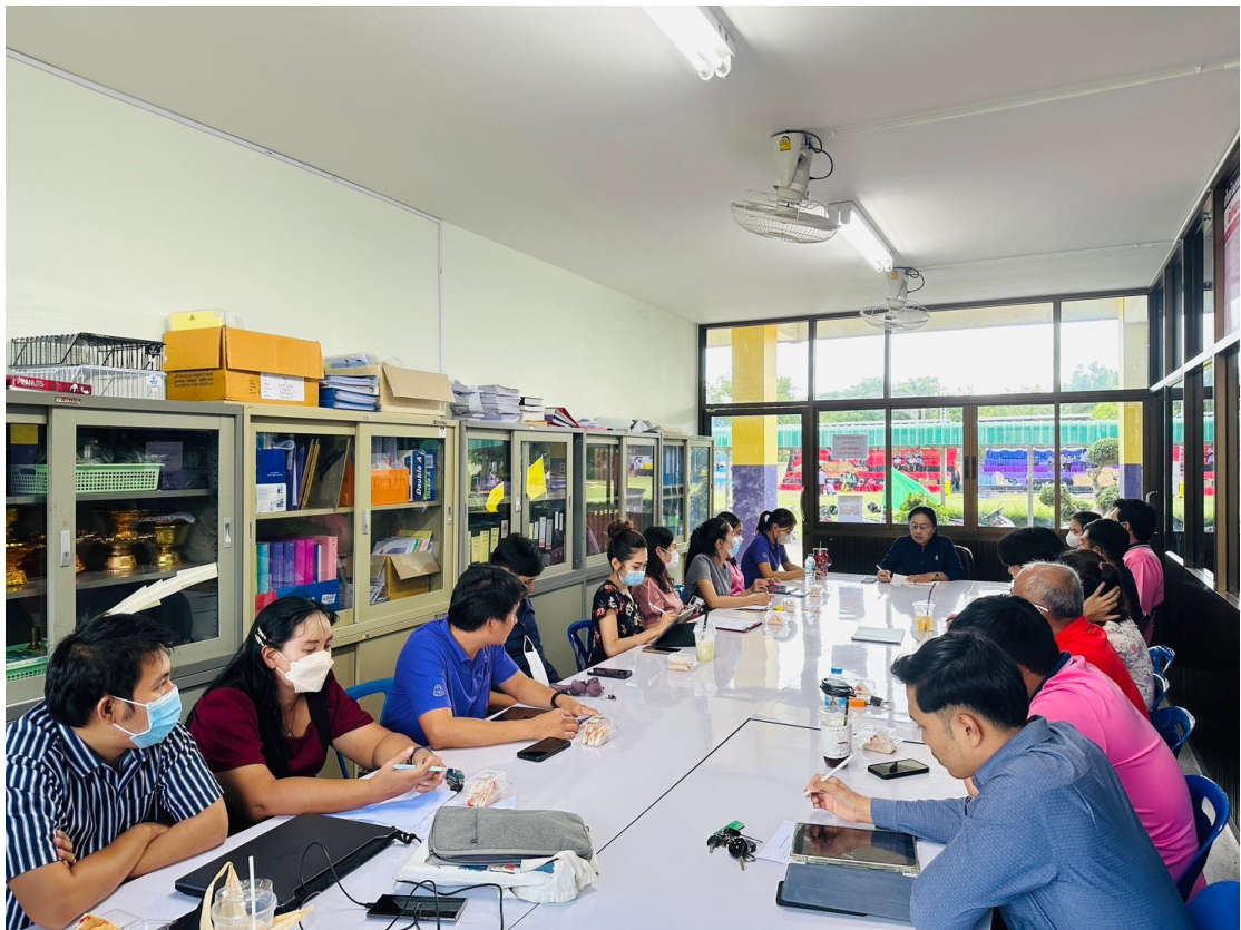
ประชุมคณะกรรมการขับเคลื่อนการเสริมสร้างมาตรฐานทางจริยธรรมฯ