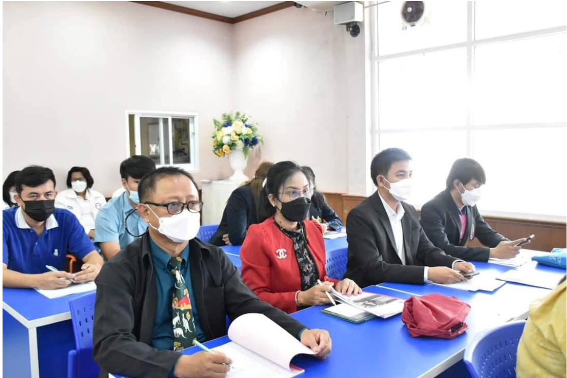
การอบรมเชิงปฏิบัติการ การประเมินคุณธรรมและความโปร่งใสในการดำเนินงานของสถานศึกษาออนไลน์